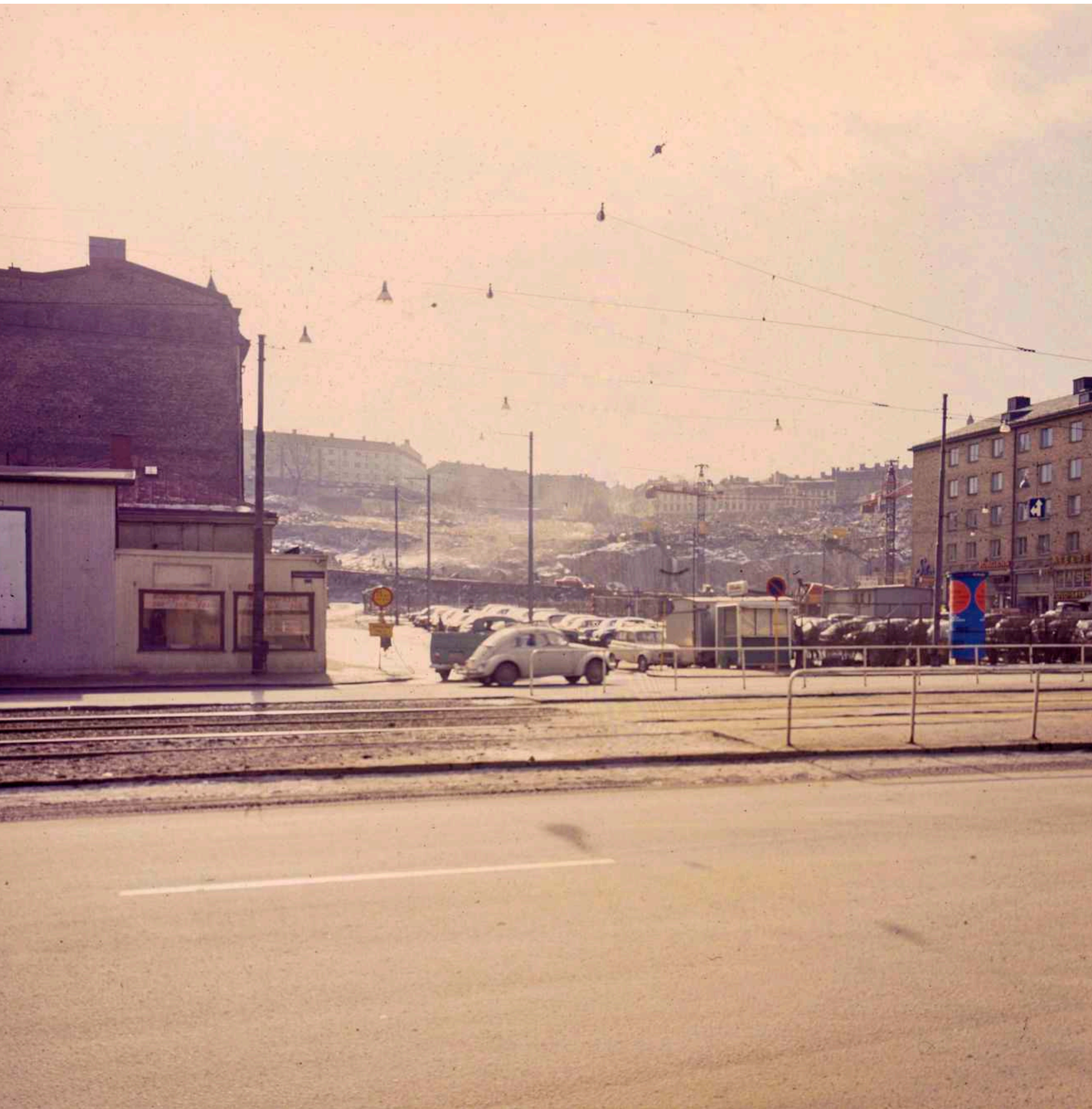
Masthuggstorget och byggarbetsplatsen för det stora bostadsområde som uppfördes på Masthuggsberget av Riksbyggens projekteringskontor 1964-71. Motstående sida: Hammiljö med fartyget M/S Racken, byggt 1949 på Karlstad varv.