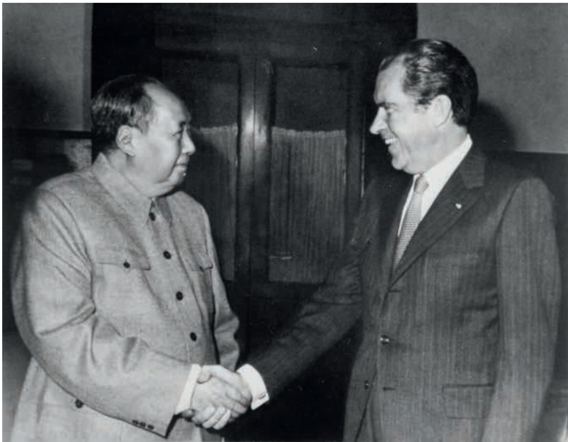
Möte mellan USA:s president Richard Nixon och Kinas partiordförande Mao Zedong i Peking 1972. Det var första gången en amerikansk president besökte Folkrepubliken Kina. Nixon kallade själv besöket »the week that changed the world«.