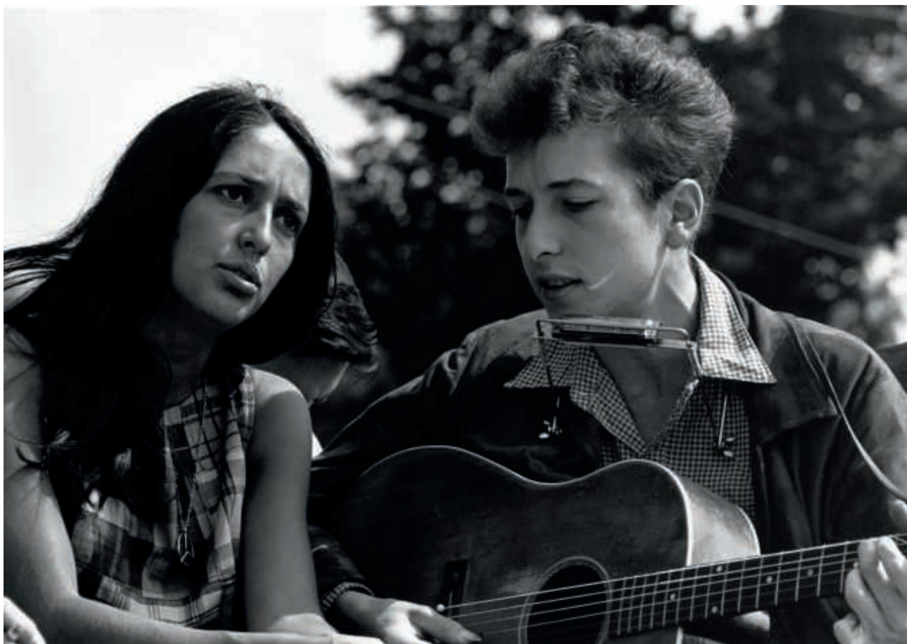
Vid det stora protestmötet i Washington den 28 augusti 1963, som organiserades av Martin Luther King, sjöng Joan Baez tillsammans med folkmassan »We Shall Overcome« och »Oh Freedom«. Bob Dylan framförde »Only a Pawn in Their Game«, och sedan »When the Ship Comes In« tillsammans med Baez. Mötet följde på en marsch med mer än 250 000 deltagare, som visade stöd för medborgarrättslagstiftningen. Vid Lincoln Memorial höll Luther King sitt berömda tal med de återkommande orden »I have a dream«.